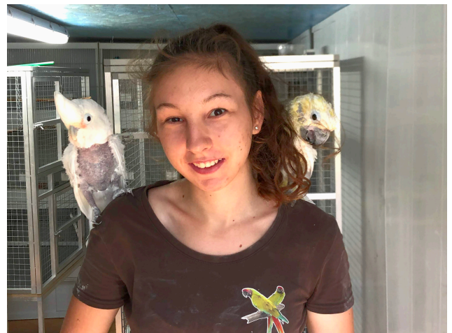
Chico und seine Freundin